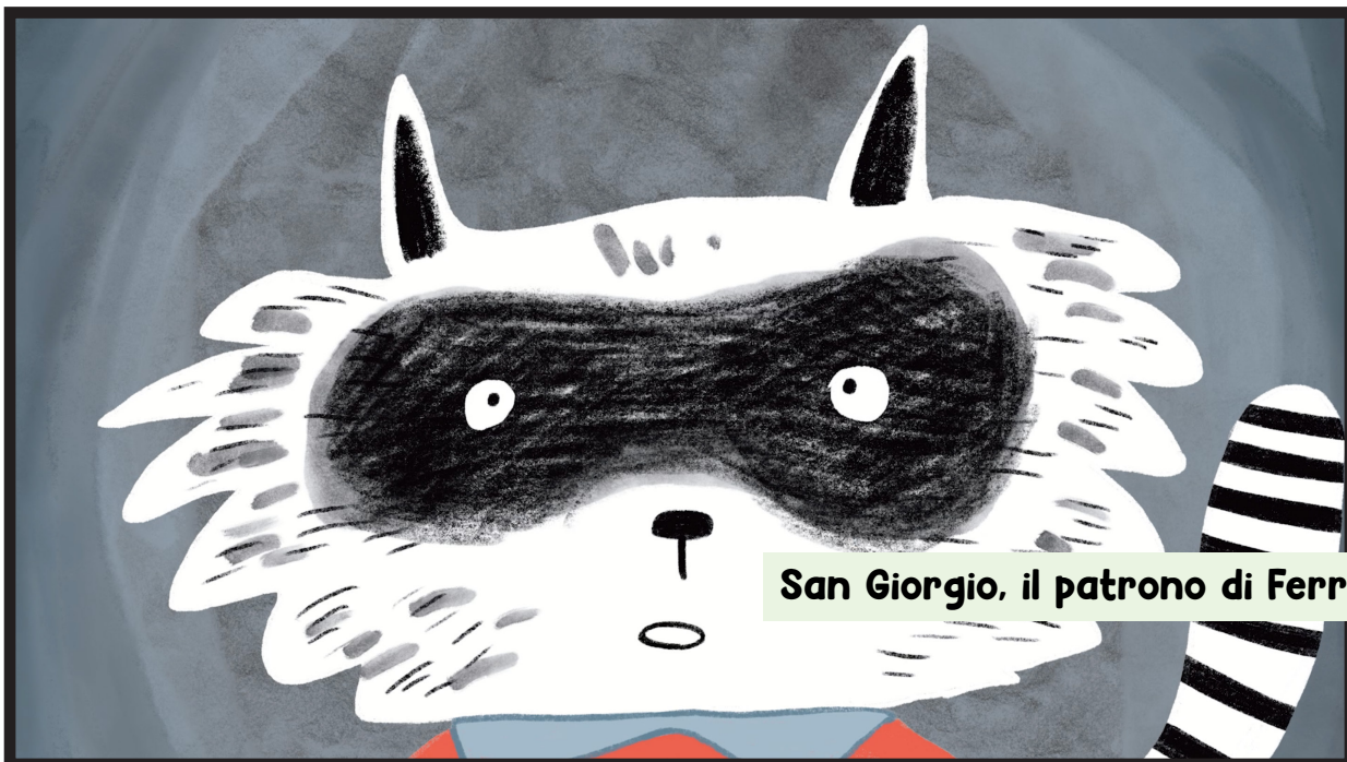
San Giorgio, il patrono di Ferrara!