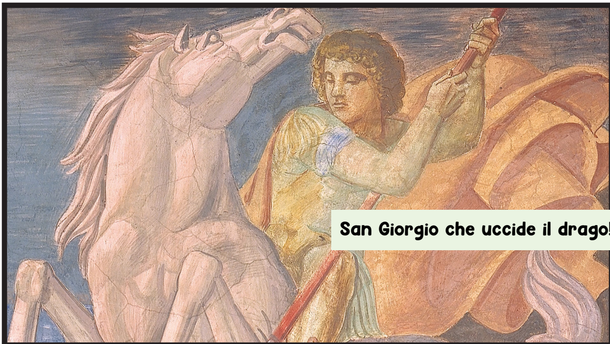
San Giorgio che uccide il drago!