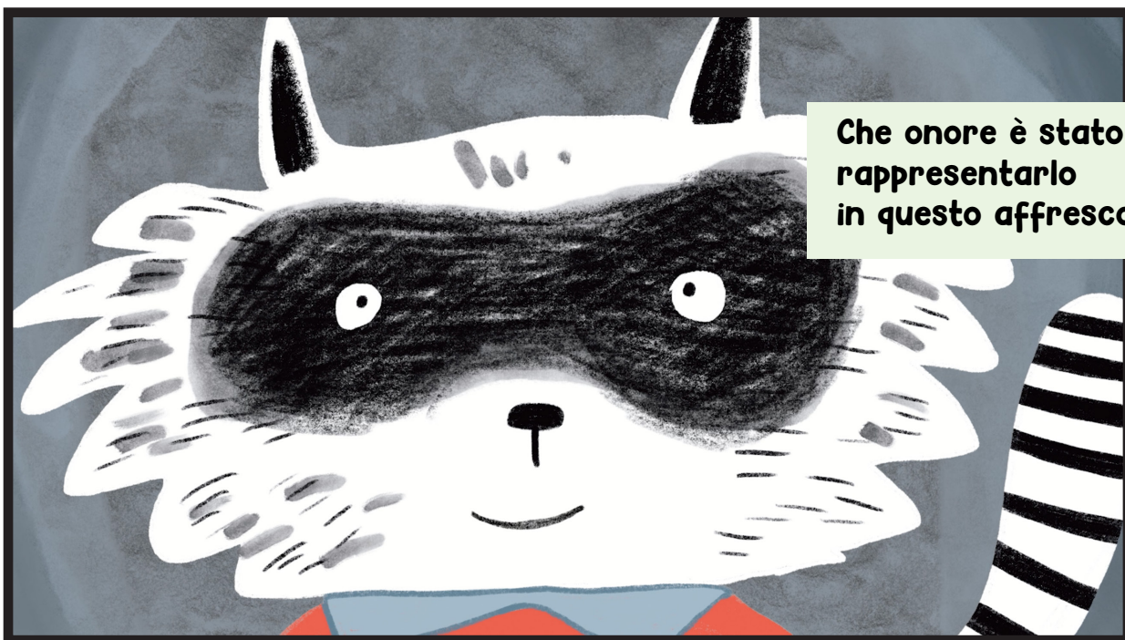
Che onore è stato rappresentarlo in questo affresco